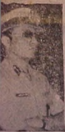
श्रीलंकेचे जनसंघ... श्रीलंकेचे जनसंघ... श्रीलंकेचे जनसंघ...