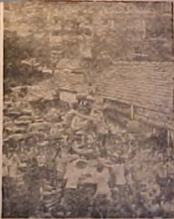
ए.म. टी. ची काटकसर मांहीम डिझलच्या वचतीचा प्रयत्न काटकसर मांहीम डिझलच्या वचतीचा प्रयत्न

गात ले टि. वटी. गाण. क्या दल. गा. ए. ए. ए.